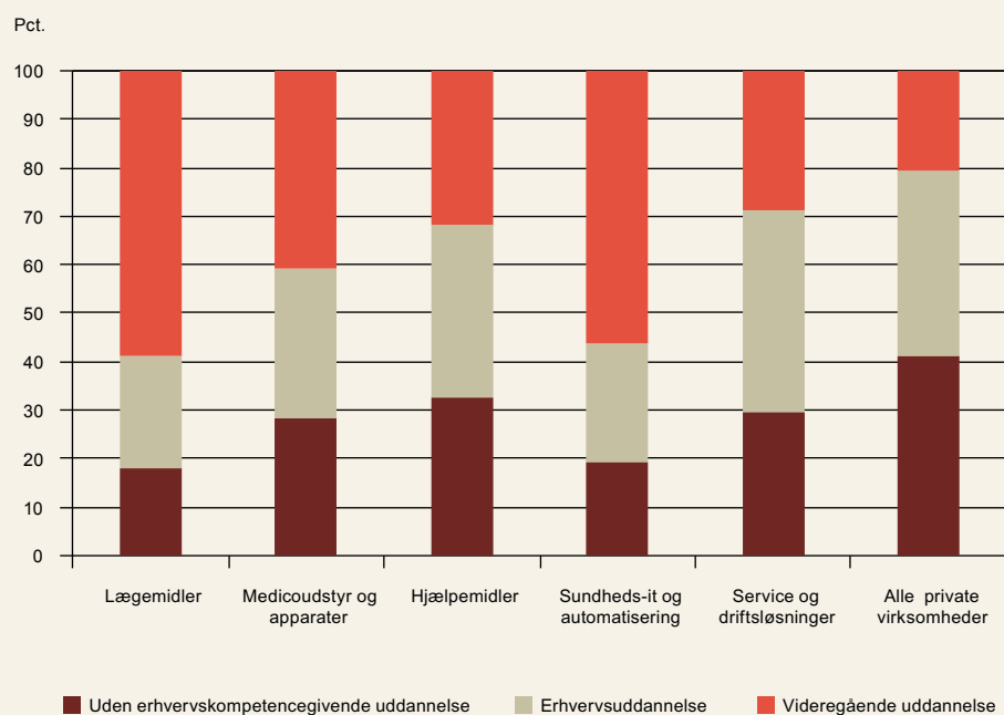
Figur 3. Uddannelsessammensætning i danske virksomheder inden for sundheds- og velfærdsløsninger

Anm.: Inkl. beskæftigede i kvasi-offentlige service- og driftsvirksomheder. Uden erhvervskompetencegivende uddannelse omfatter grundskole, almen- og erhvervsgymnasial uddannelse samt uoplyst uddannelsesniveau.